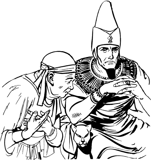
फारो हाड् नुड् खोम् योम्पक् मुखुबा

‡ हाड् डुड्मा पीक्खुबाऐ हाड् लोसु, "के मीइखेडुडे खानावाँ आइ मीट्टकुड्। † आना कानुड् आम्चामखेन् पेक्खुबा टुड्घड्पानुड् याक्चाआना हाड् आने आम्