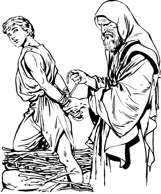
आब्राहाए इसहाक्मी हुक् ही:क्मीम्पा

१२ नीवाँखाटेखुबाए लोसु, "आम् पासा सकपी हुक् आठेरे, आक्क माङ्स आलेटे। ह के लेसुङ् आना नीवाँहाङ्मी