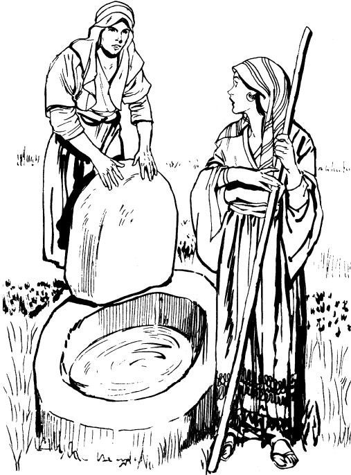
याकुबऐ इनारामी याः डेंक्मीम्पा लुङ्क?वा टेःबम्पा

८ खाचीऐ लोसुची, "चोप्न बागाला माखोम्टीखे?लढारी हाङ् इनारामी याःबीऐ लुङ्क?वा माटेःरढारी आक्क लेंहीसुङ्कानी। आक्क लीहाङ् टेः काङ्के मेठुबानुङ् सामुङ्ची योवा डुङ्मीहीकुङ्का।